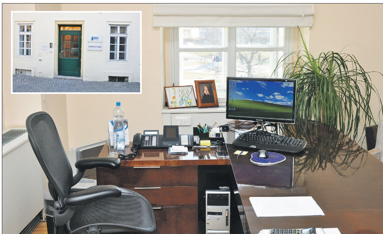
Zde má společnost Neocity Group kanceláře, které i navzdory Bendlova mínění fungují.

Ten novináře provedl i po „neexistující kanceláři“ společnosti, kterou vede. „Petr Bendl by si měl nejdříve zjistit realie a pak až mluvit,“ říká MUDr. David Rath. Bendlovu kritiku bere jako absurdní, a to například vzhledem k realizaci tzv. okruhu obce Lány. Za 300 milionů korun z rozpočtu Středočeského kraje realizovala čtyřproudovou silnici, která vede prakticky k domu, kde bývalý hejtmán Bendl bydlí.