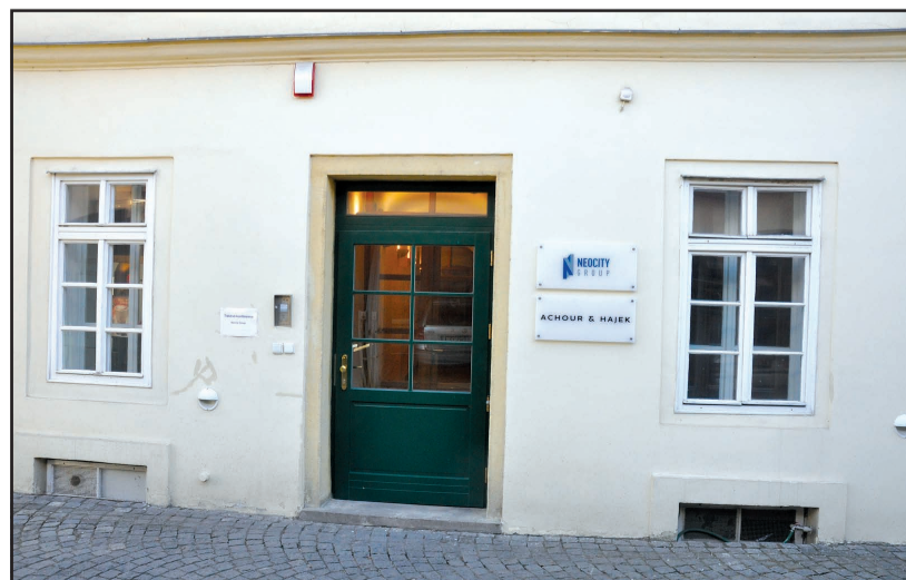
Zde má společnost Neocity Group kanceláře, které i navzdory Bendlova mínění fungují.