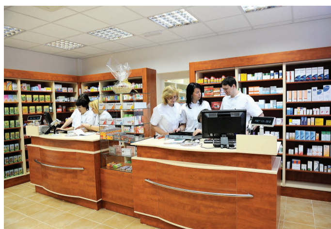
V kutnohorské nemocnici mají vlastní lékárnu

V kutnohorské nemocnici funguje od prvního dubna nová lékárna. Na slavnostní otevření se